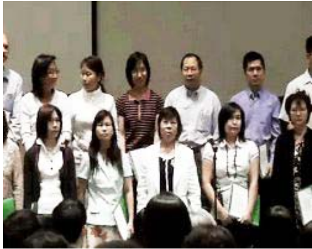
四月十二日復活節茶會圖片